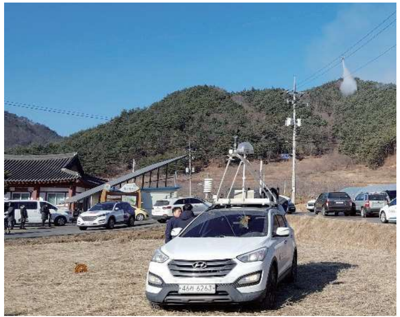
이동식기상관측차량 뒤쪽 산에서 헬기로 진화하는 모습