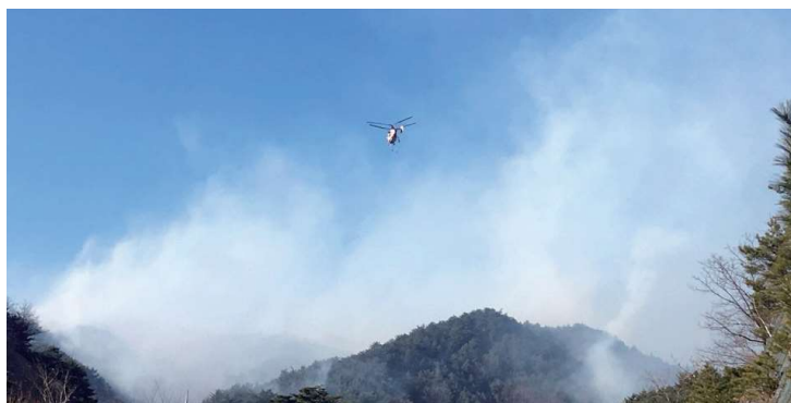
1월 2일 오전 진화 모습