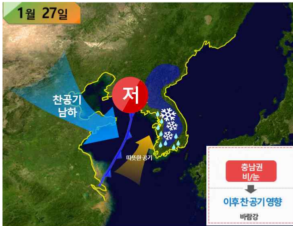
[ 27일 기압계 모식도 ]