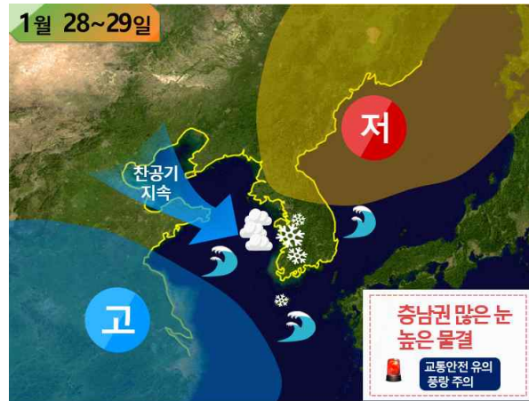
[ 28~29일 기압계 모식도 ]