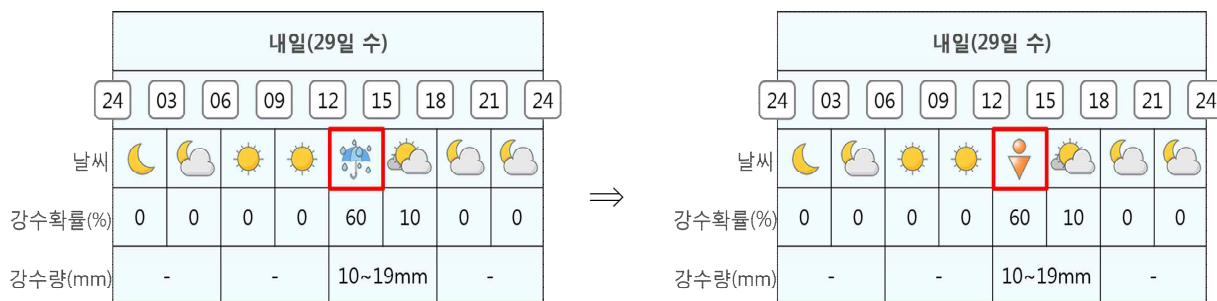
(현재) '비'로 예보