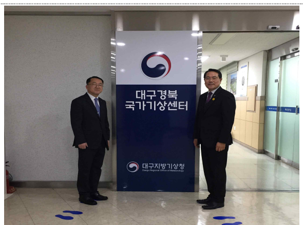
| 대구·경북국가기상센터 앞 |