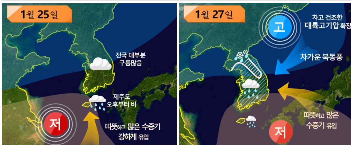
[ 설 연휴기간 날씨 모식도 ]