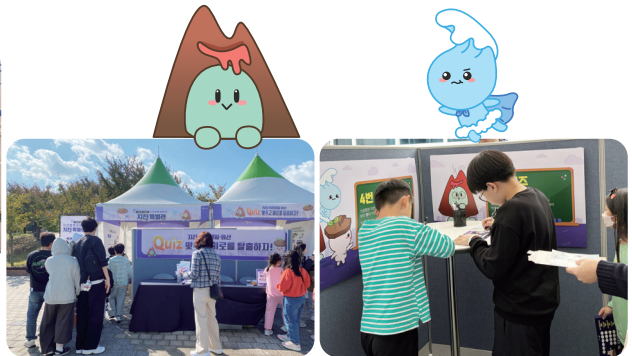
지진안전캠페인 부스(국립대구기상과학관) 지진안전캠페인 부스(국립전북기상과학관)