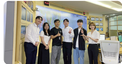
2025 지진과학정책 토크콘서트(사진 위) 유튜버 '땀'과 함께한 지진 공익광고 촬영(사진 아래)