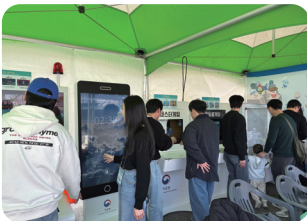
세계기상의 날 지진홍보부스(대전)