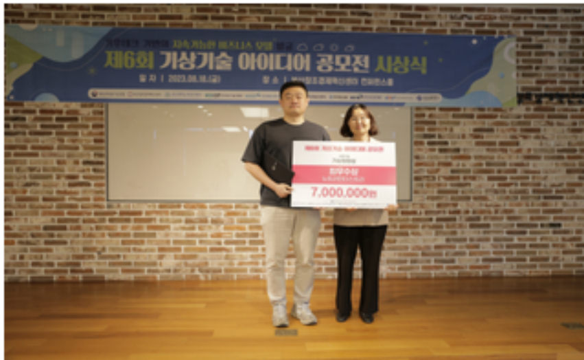
사업화기술 최우수상 '뉴트리인더스트리'