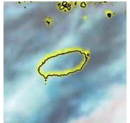
23일 23시 위성영상

□ 지속적인 난기의 유입과 짙은 구름으로 인한 열 방출의 차단으로 3월 일최저기온 (최고) 기록이 경신됐다.