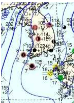
24일 00시 편집일기도