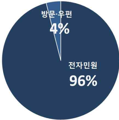
<기상청 전자민원 이용률>