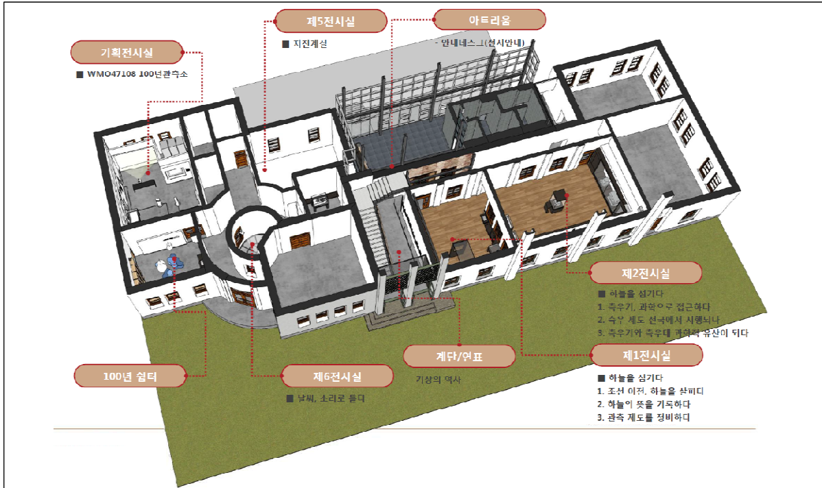
[그림] 국립기상박물관 1층