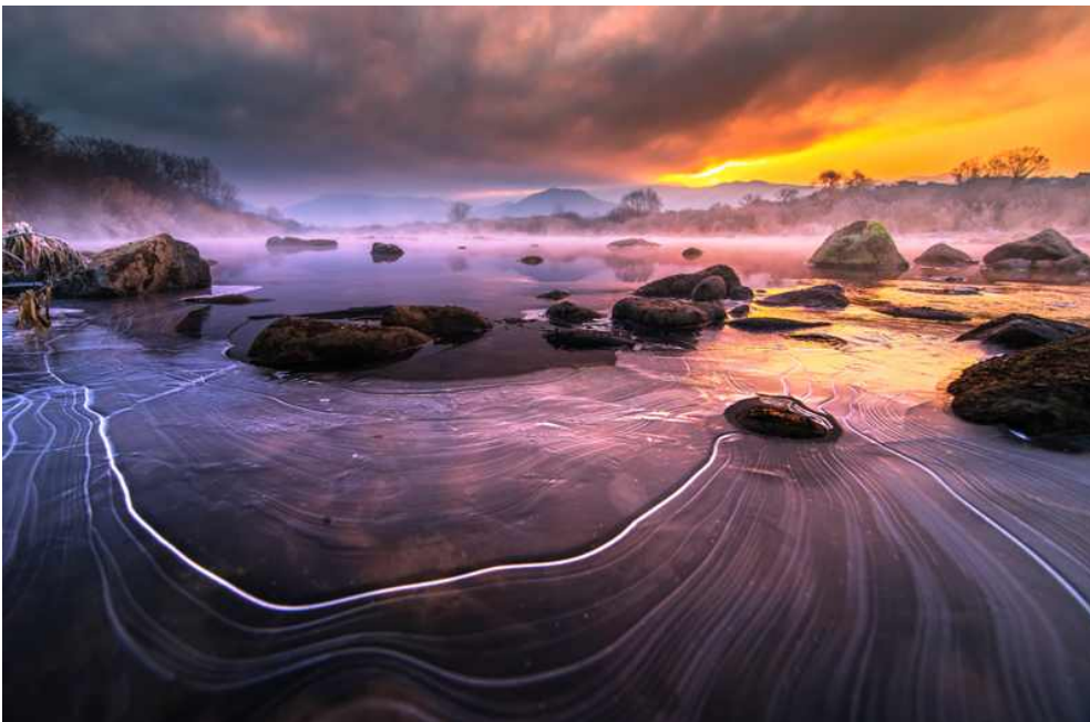
| 혹한의 아침을 열다(오권열 作) WMO 2019년 달력 2월 |