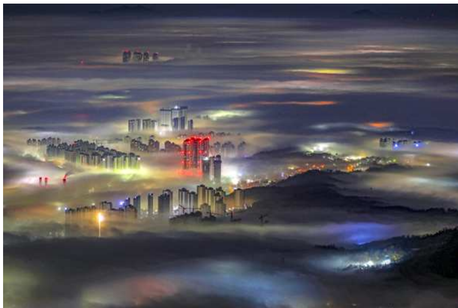
| 세계기상기구 2021년 달력 사진으로 선정된 안개도시(방춘성 作) |