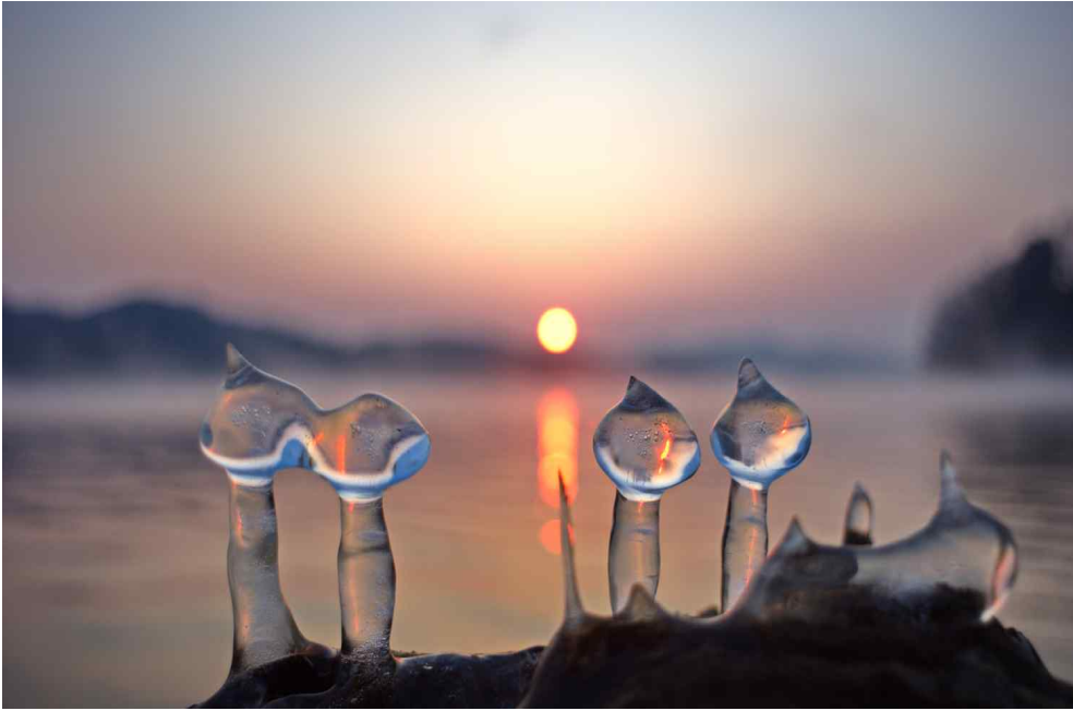
| 대청호의 고드름(윤석현 作) WMO 2020년 달력 3월 |