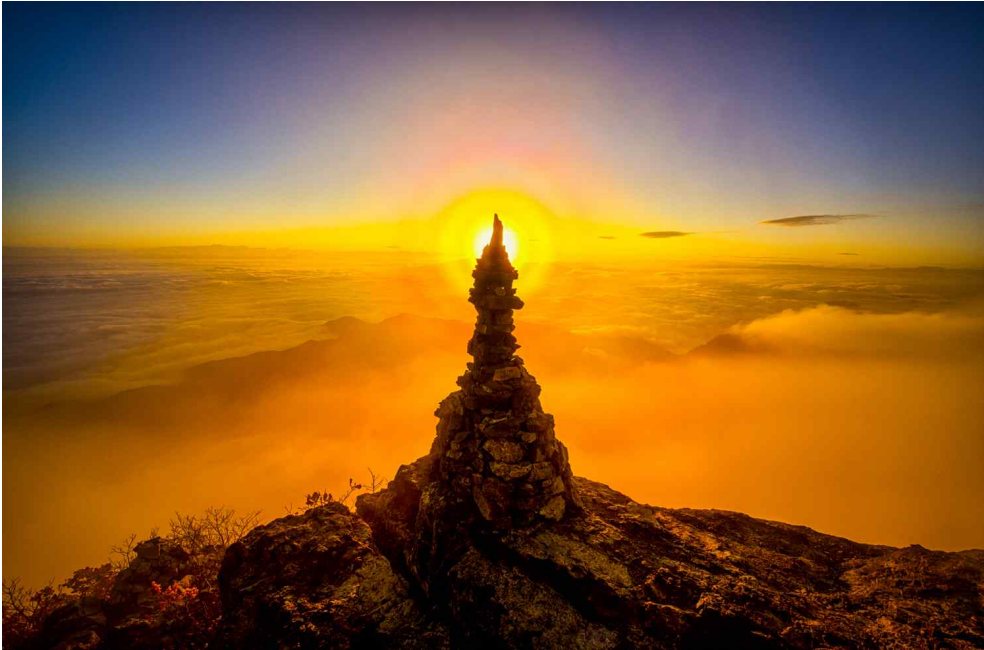
| 돌탑과 햇무리(신규호 作) WMO 2019년 달력 표지 |