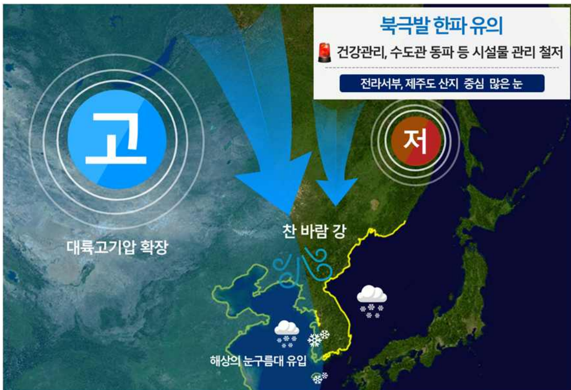
[ 1월 7일 오후 예상기압계 모식도 ]