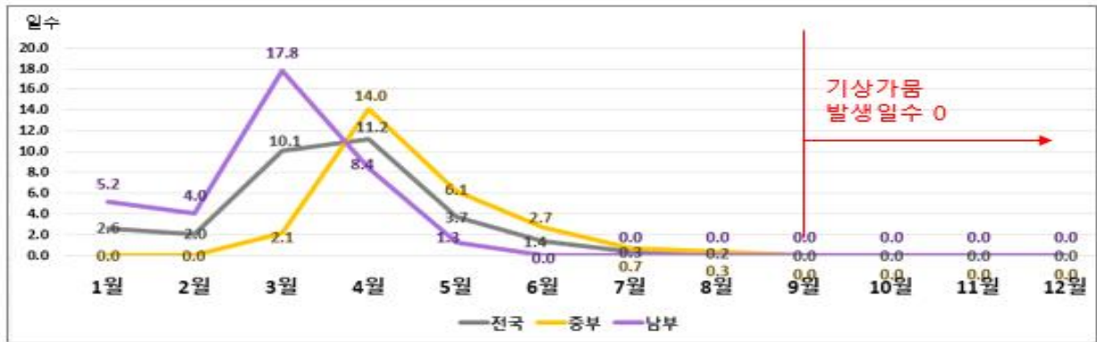
<2023년 월별 기상가뭄 발생일수>

- [여름철 기상가뭄 해소] 특히 여름 장마철(6.26.~7.26.) 동안의 많은 비로 중부 일부 지역의 기상가뭄도 해소되어 9월에서 12월에는 기상가뭄 발생이 없었다.