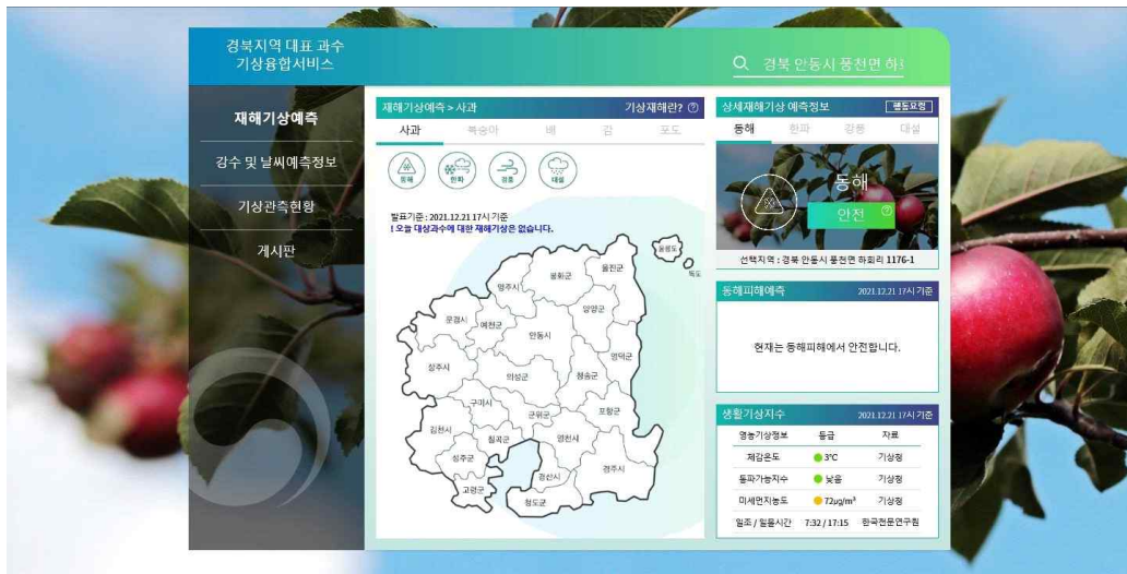
웹 서비스 홈페이지