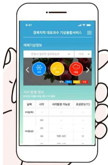
모바일 앱 서비스