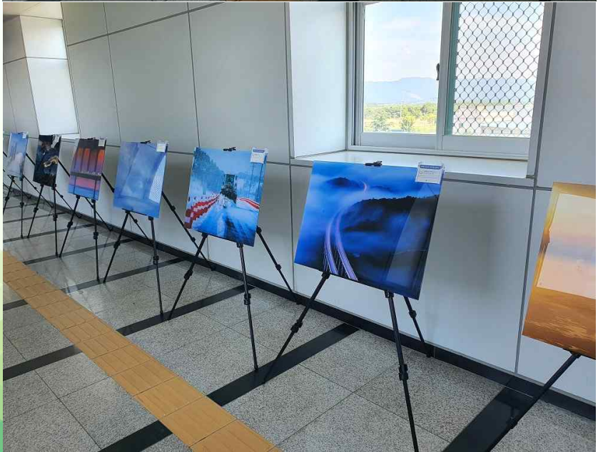
춘천역 기후기후사진전 전시 모습