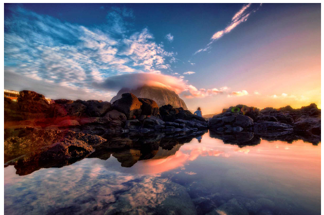
[은상] 구름모자 쓴 산방산과 반영 / 김민좌 作