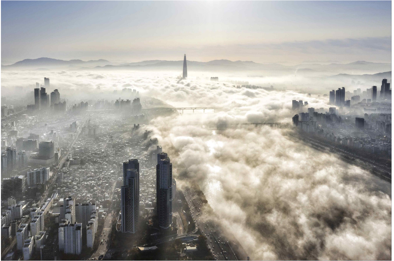
[대상] 안개주의보 / 나기환 作