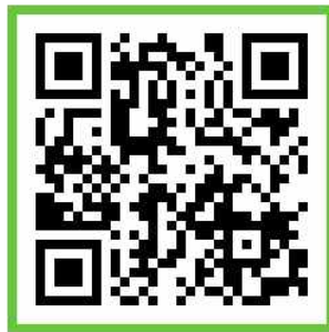
온라인 갤러리 QR코드