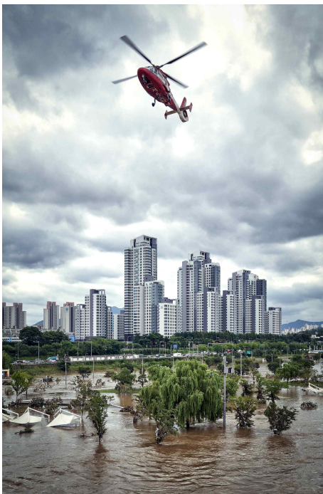
[금상] 도시를 구하라 / 정규진 作