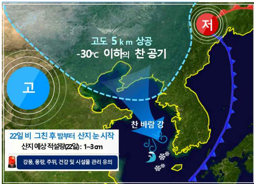
[ 11월 22일 기압계 모식도 ]