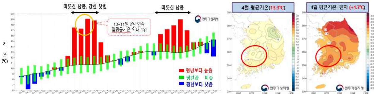
【그림 1】 4월 전라북도 평균기온 일변화 시계열(좌) 및 평균기온 분포(우)