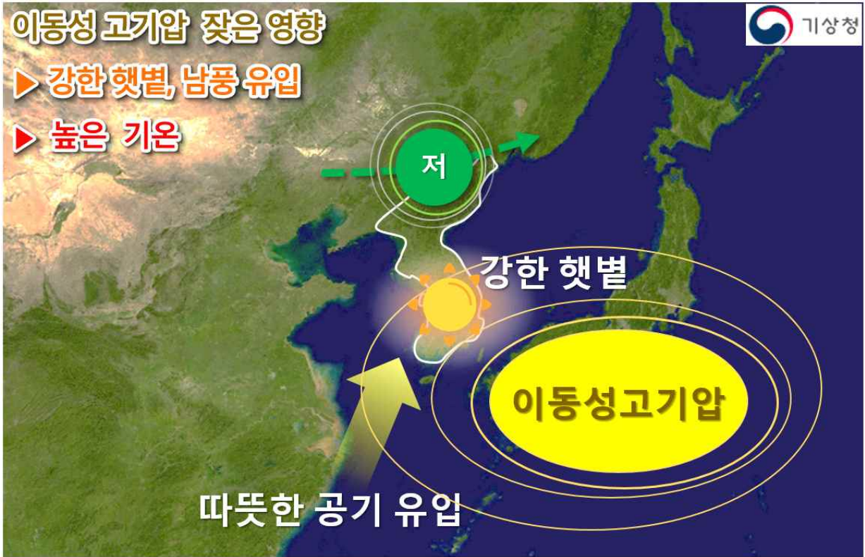
【그림 3】 4월 기압계 모식도