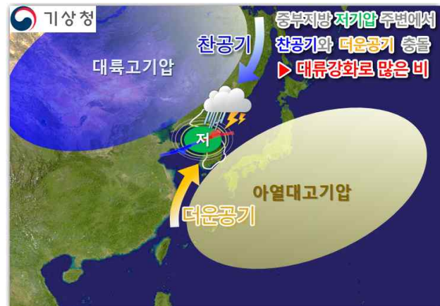
【그림 4】 2022년 10월 3일~4일 기압계 모식도