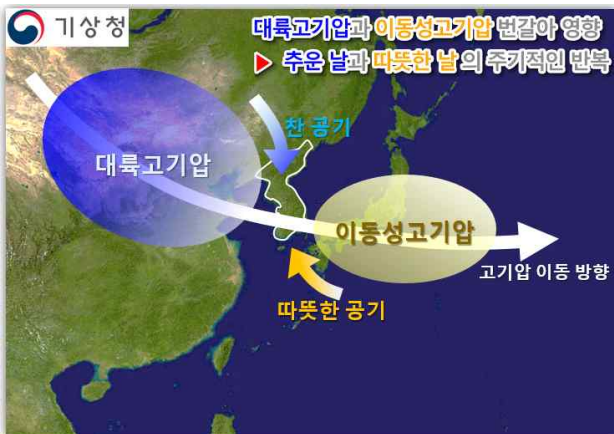
【그림 3】 2022년 10월 기압계 모식도