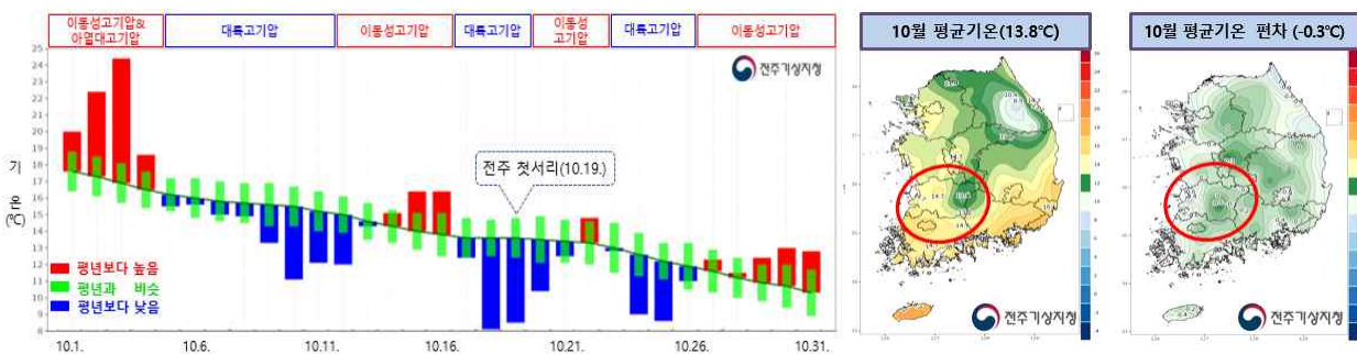
【그림 1】 2022년 10월 전라북도 평균기온 일별 시계열(좌) 및 월평균 분포도(우)

※ 전주 첫서리 관측일(평년대비): 10월 19일(13일 빠름, 1973년 이래 6위)