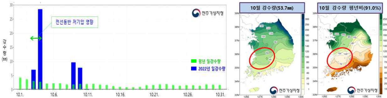
【그림 2】 2022년 10월 전라북도 강수량 일별 시계열(좌) 및 월누적 분포도(우)

※ 10월 3일~4일 강수량: 함라(익산) 74.0mm, 어청도(군산) 70.5mm