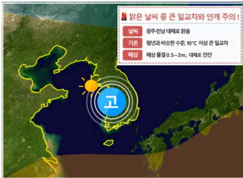
[ 11월 17일(목) 예상기압계 모식도 ]