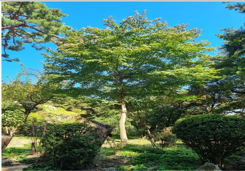
북한산 삼성암 주차장 근처