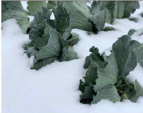
제주시 한경면의 한 양배추밭이 며칠째 내린 폭설로 눈 속에 파묻혀 있다. 겨울철 밭작물들의 한파 피해가 우려되고 있다.

한라산 최대 50cm ↑ 폭설... 빙판길 낙상·차량 고립 사고 잇따라 "한동안 추위 지속"