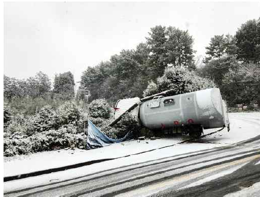
22일 발생한 LPG운반차량 미끄러짐 사고.

세일 최강한파를 맞고 온 동장군이 명위를 떨치고 있다. 올 겨울 가장 추운 날씨를 보이고 있는 23일 제주도에선 강풍을 동반해 최대 70cm가 넘는 폭설이 내리면서 하늘길과 바닷길이 완전히 끊겼다.