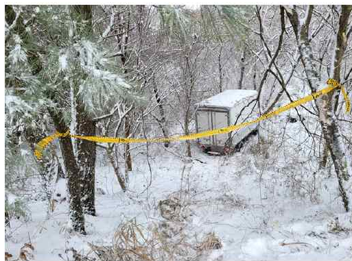
22일 발생한 눈길 교통사고.