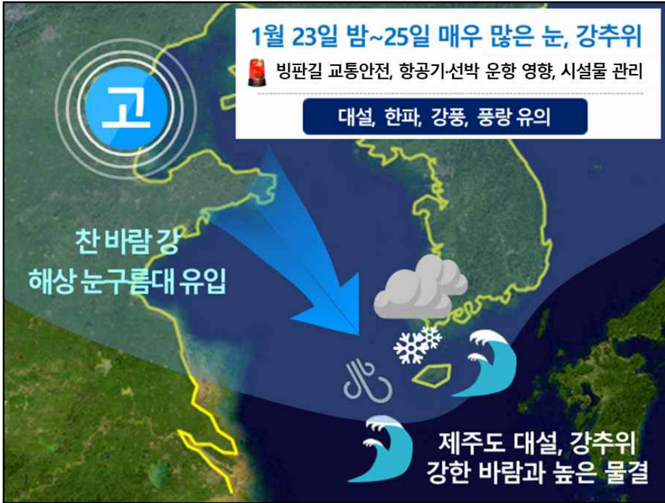
[ 1월 23일(월) 밤~25일(수) 예상 기압계 모식도 ]

□ 제주지방기상청(청장 전재목)은 1월 23일(월) 밤부터 1월 25일(수)까지 위험기상이 예상됨에 따라, 국민생활 안전과 편의를 위해 상세한 기상전망을 발표하였다.