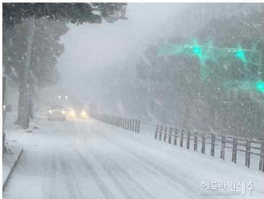
23일 아침, 제주 시내 거리에는 많은 눈이 쌓인 가운데 강한 눈보라가 몰아치고 있다. <헤드라인제주>

대설특보 발효 속 많은 눈...도로 곳곳 통제, 출근길 큰 불편 제주공항 이틀째 무더기 결항...교통사고, 보행자 낙석 속출 24일까지 많은 눈 예보...재난본부 2단계 비상체제 돌입