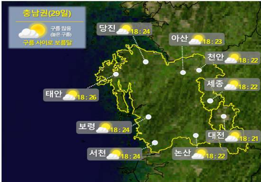
[ 9월 29일(금) 대전·세종·충남 월출 시각 ]