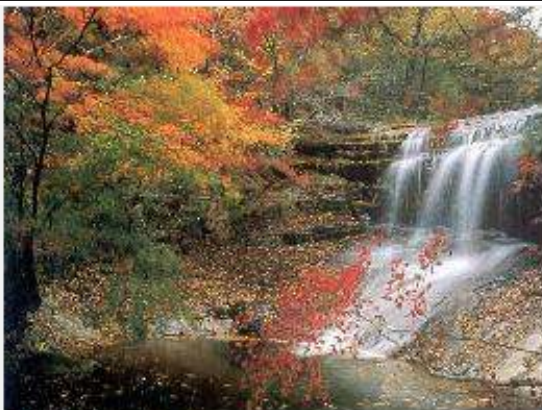
월악산 단풍과 만수계곡