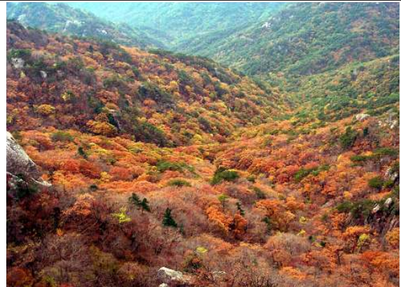
능선에서 바라본 속리산 단풍