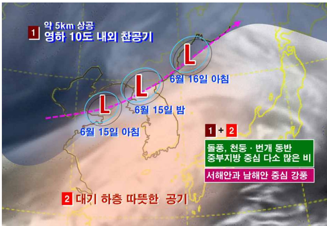
< 2016년 6월 15일(수) 낮 기압계 모식도 >