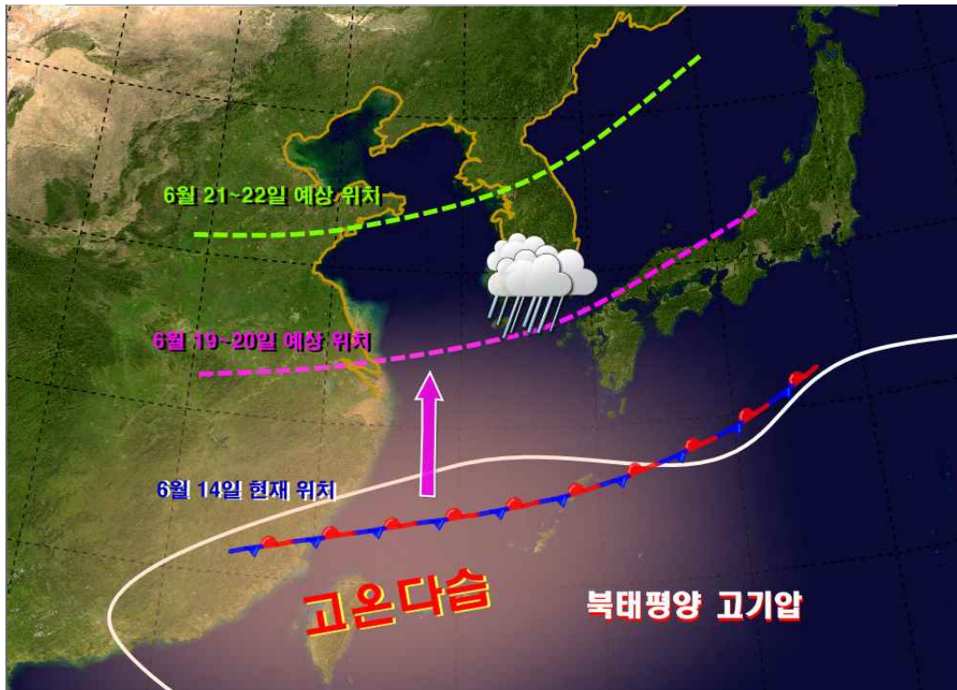
< 2016년 6월 19~22일 장마전선 위치 예상 모식도 >