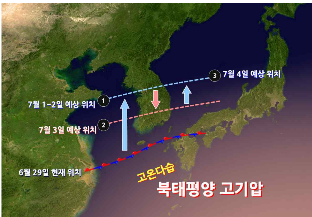
< 2016년 6월 29일~7월 4일 장마전선 위치 예상 모식도 >