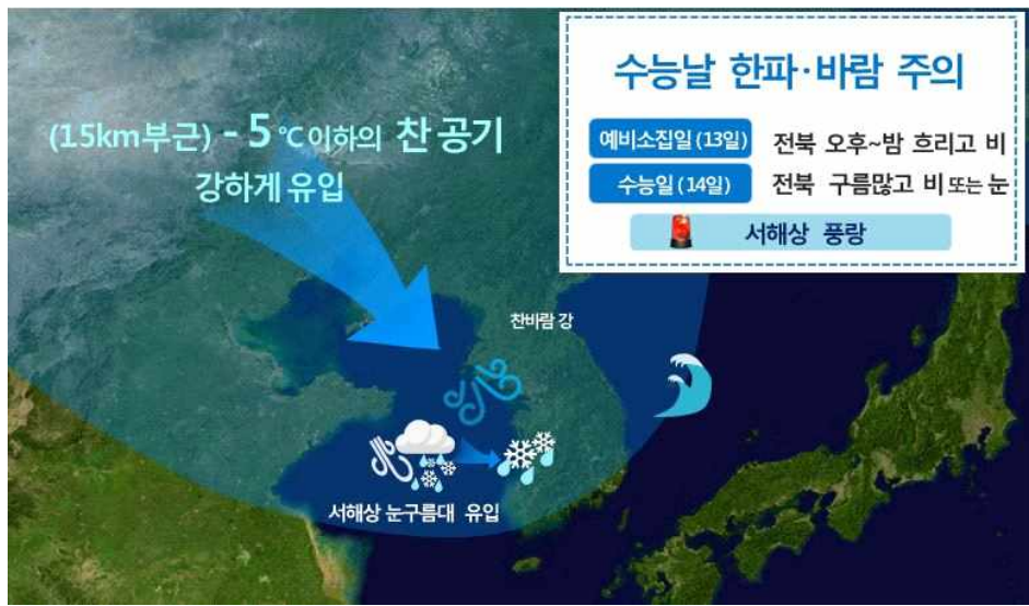
[11월 14일(수능 당일) 기압계 모식도]

2020학년도 전라북도 대학수학능력시험일(14일) 기상전망 ○ 13일 오후~밤 흐리고 비, 14일 구름많고 비/눈 ○ 13일 오후~14일, 기온 큰 폭으로 떨어져 - 14일 전주 아침 최저기온 4도, 수능한파 유의 - 강한 바람, 체감온도 5~10도 가량 낮아 더욱 춥겠음