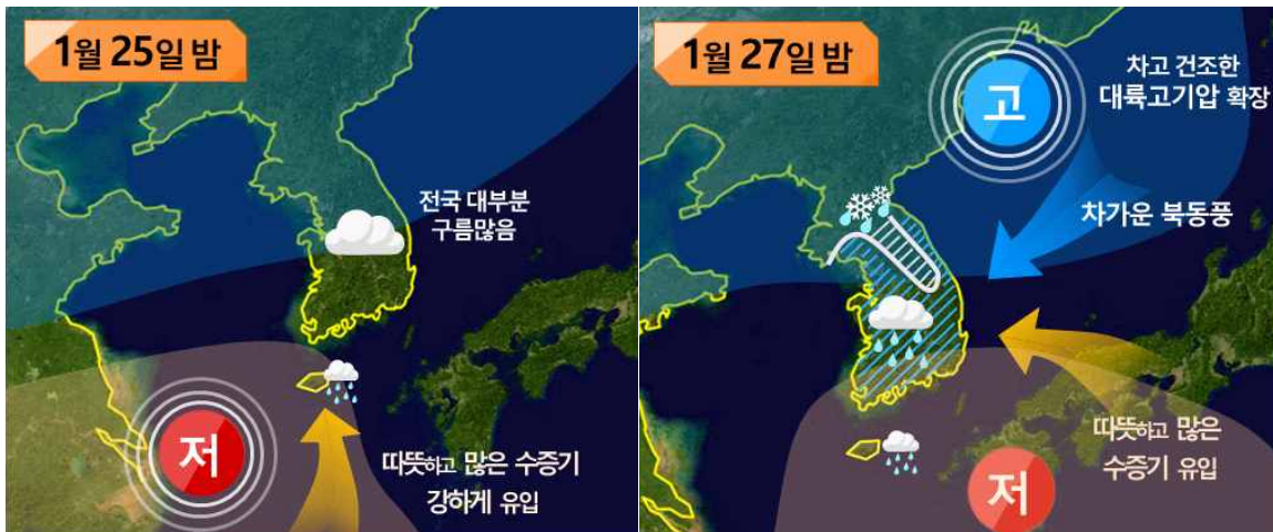
[ 설 연휴기간 날씨 모식도 ]