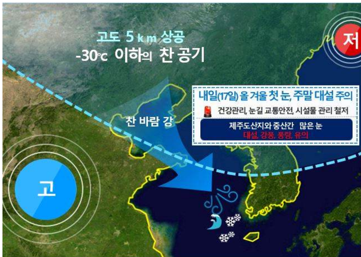
[ 12월 17일 밤 기압계 모식도 ]