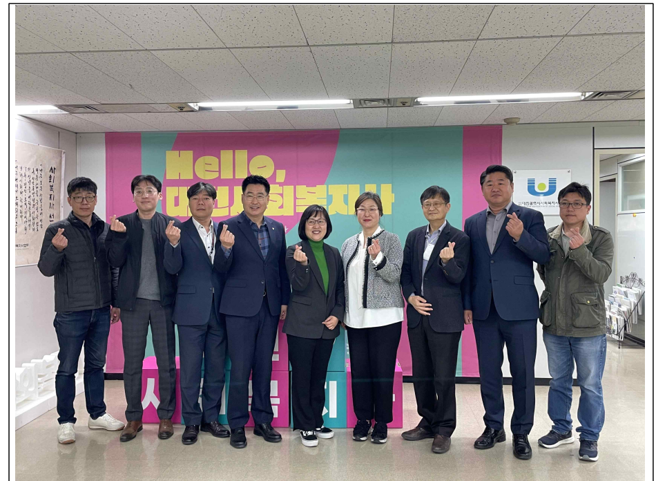
한발 어르신 재해 예방 협의회 발족식 (대전지방기상청 방재소통팀장 및 대전광역시 8개 노인종합복지관장 8인)