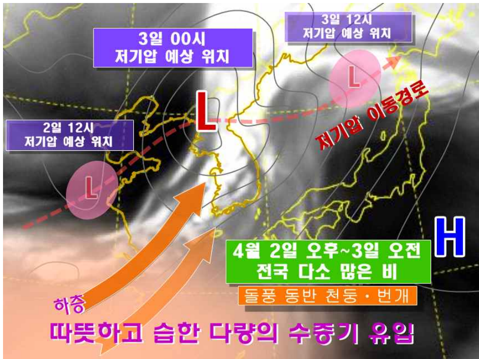
< 2015년 4월 2~3일 예상 기압계 모식도 >

내일(2일) 오후~모레(3일) 오전 다소 많은 비 - 서해상과 남해상, 일부 내륙 돌풍과 함께 천둥·번개 - 전해상 매우 강한 바람과 높은 파고