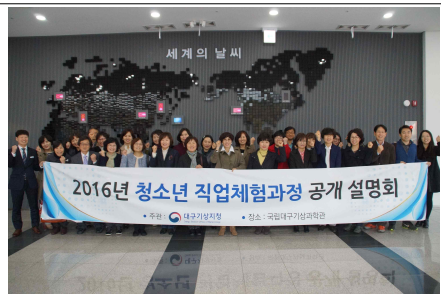
진로교사 대상 공개설명회