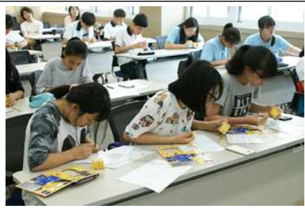
기상기후체험(교구만들기, 일기도 그리기)