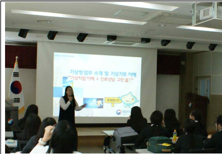
기상청 업무 소개 및 진로상담