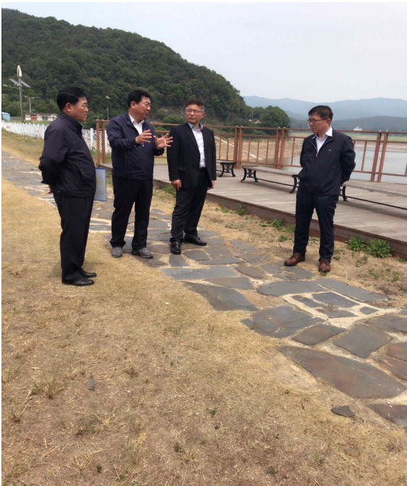
금광저수지 현장방문(저수율 2.1%)