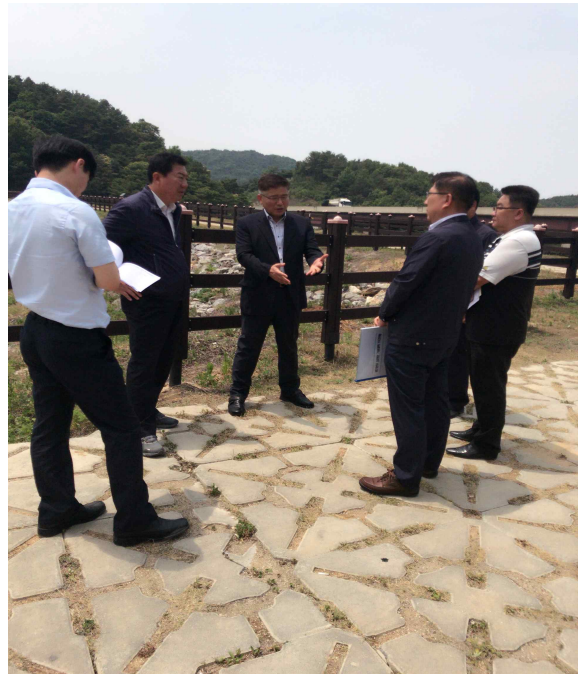
마둔저수지 현장방문(저수율 1.5%)