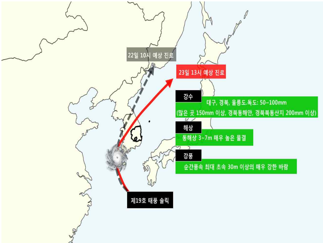
<태풍 예상 진로 모식도>

※ 태풍의 예상진로가 대구와 경북에 더 가까워져 위험기상 가능성이 강화됨