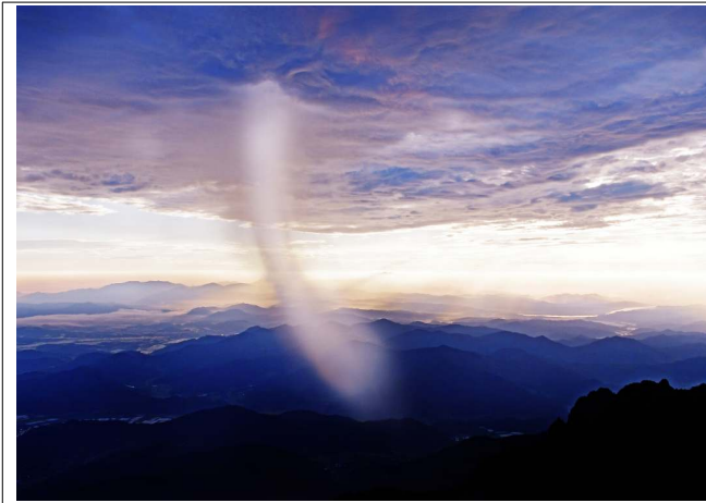
[대상] 소나기 (촬영지: 경남 합천군 가야면 치인리 가야산정상)