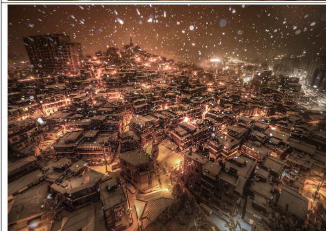
[은상] A village where Christmas falls (촬영지: 서울시 한남동)