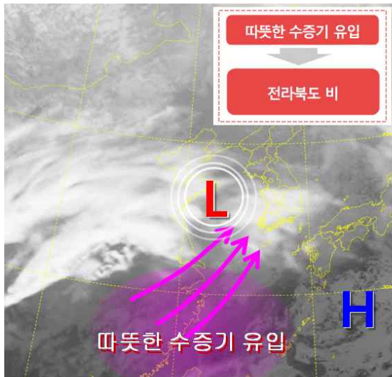
[ 6일 밤 예상 기압계 ]