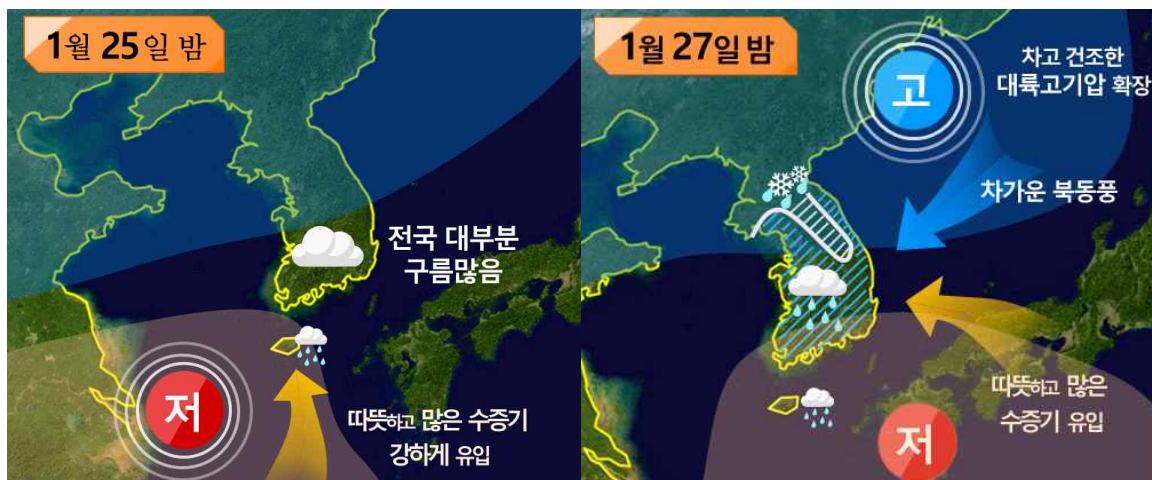
[ 설 연휴기간 날씨 모식도 ]