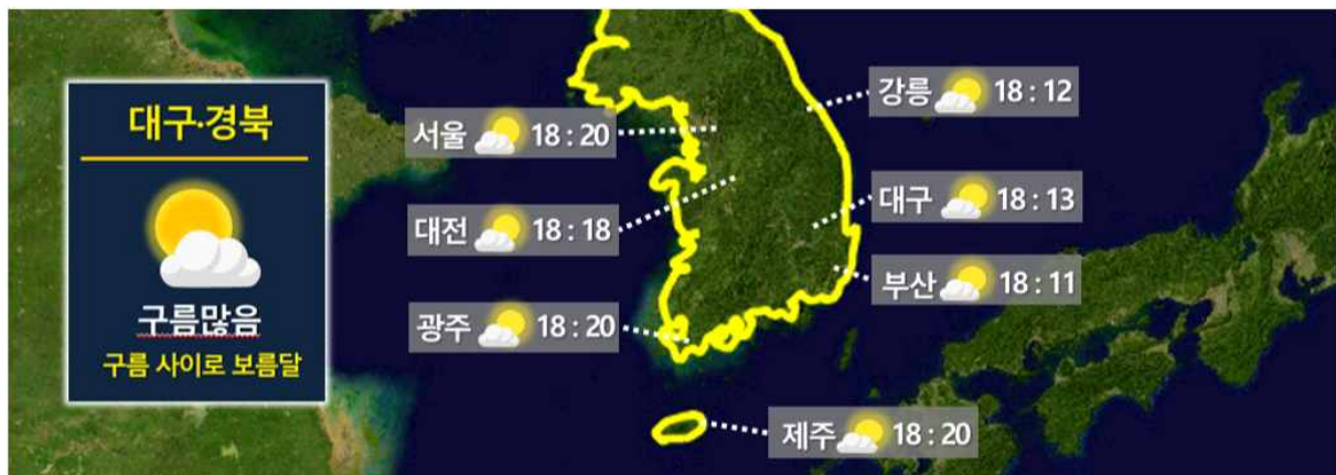
[ 10월 1일(목) 전국 월출 시각 ]