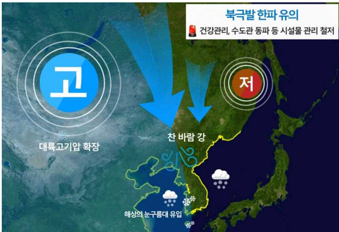
[ 1월 7일 오후 예상기압계 모식도 ]