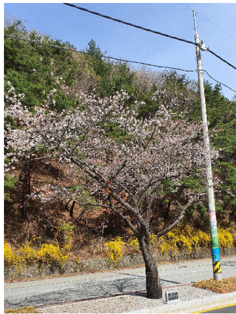
소양강댐 벚꽃 군락지 개화