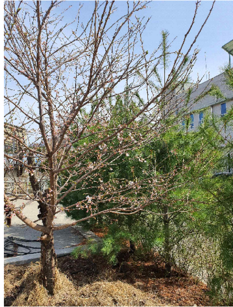
춘천기상대 벚꽃 개화