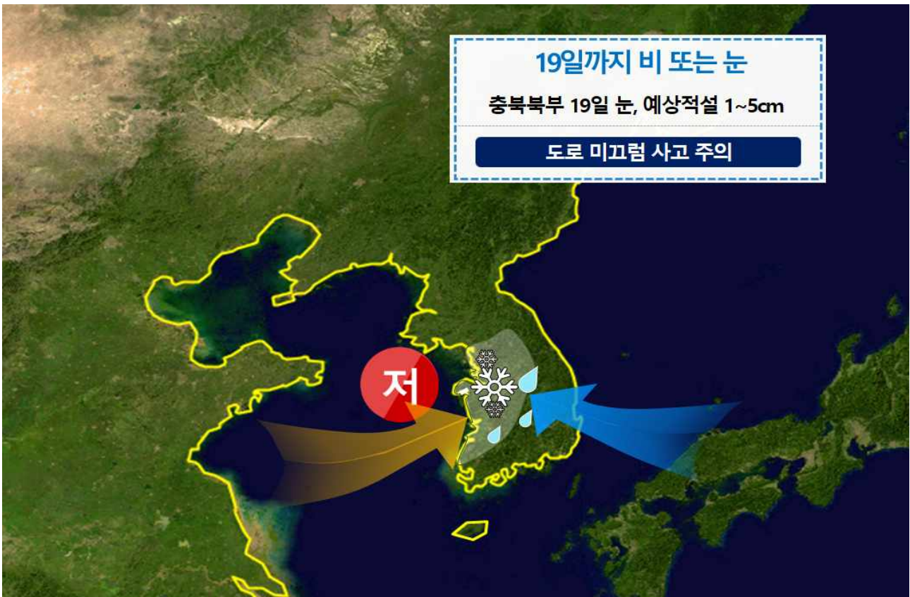
[ 모레(3.19) 기압계 모식도 ]