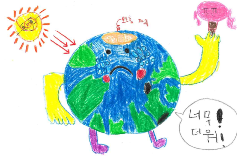
장려상 / 프렌비숲유치원 / 김○윤