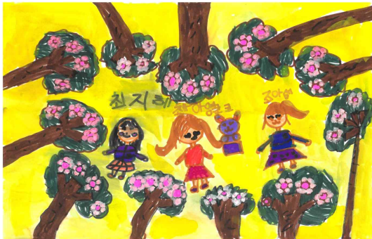
장려상 / 삼성어린이집 / 조○섭