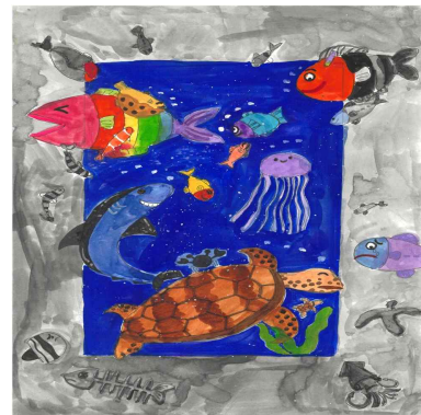
장려상 / 중앙초 / 심○윤