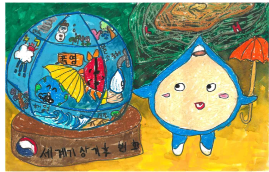
장려상 / 프렌비숲유치원 / 정 ○