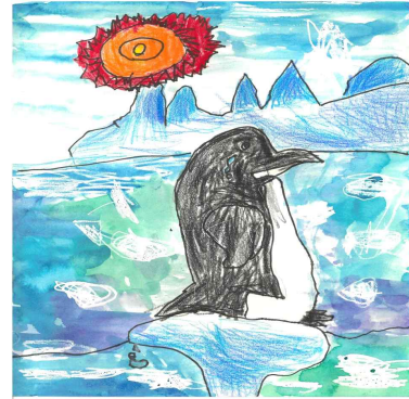
우수상 / 소화유치원 / 정○윤