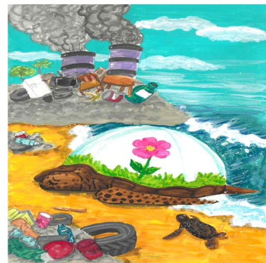
장려상 / 중앙초 / 황○유