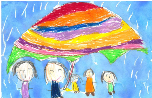
우수상 / 다경어린이집 / 이○윤