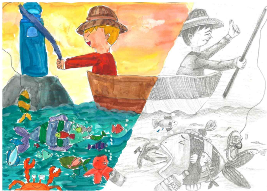
우수상 / 중앙초 / 황○인