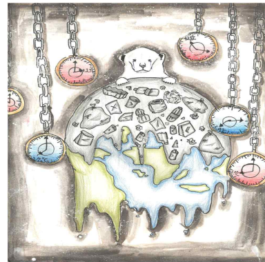
우수상 / 성덕초 / 채○윤