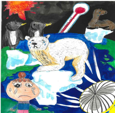
장려상 / 늘사랑어린이집 / 이○우