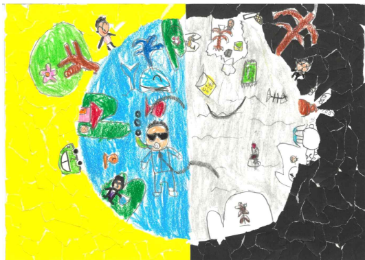
장려상 / 경포초 / 김○원