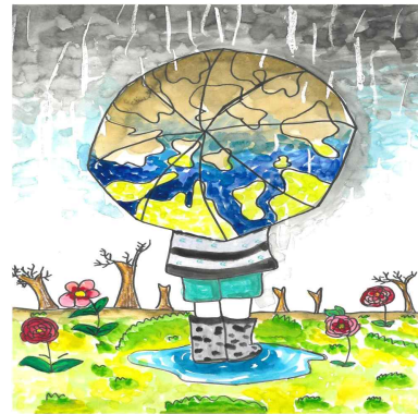
우수상 / 동명초 / 정○윤