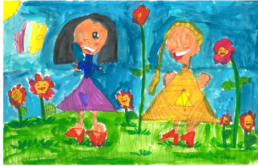
최우수상 / 하슬라유치원 / 김○영