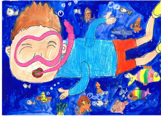
최우수상 / 중앙초 / 하○은