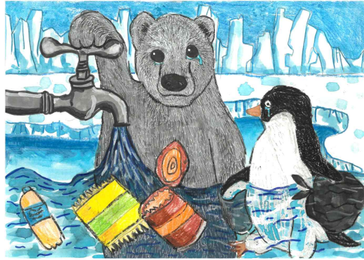
최우수상 / 동명초 / 변○양