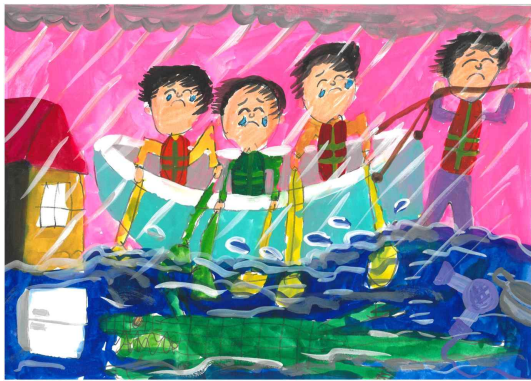
장려상 / 왕산초 / 김○욱