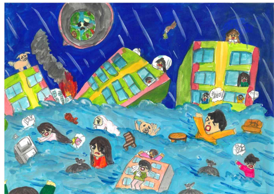
장려상 / 중앙초 / 김○경