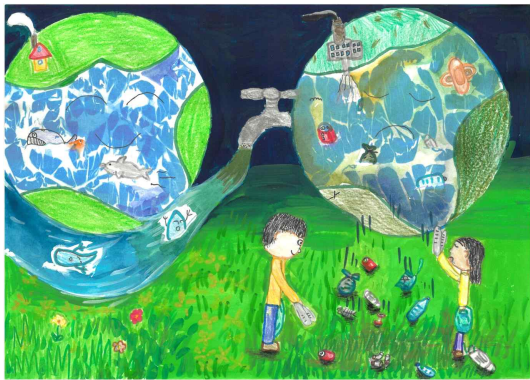
우수상 / 봉대초 / 최○진