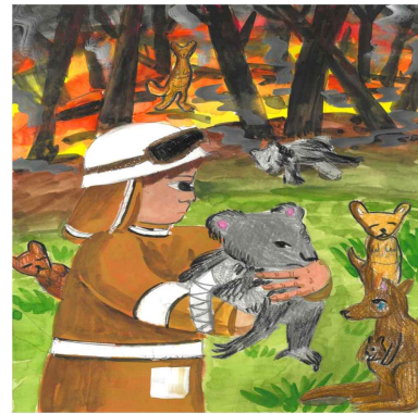
장려상 / 성덕초 / 이○우