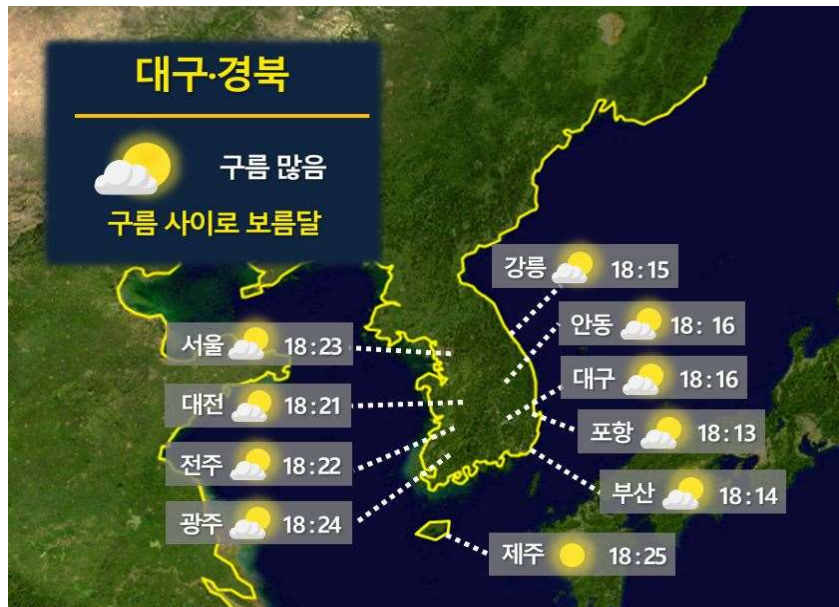
[ 9월 29일(금) 월출 시각 ]