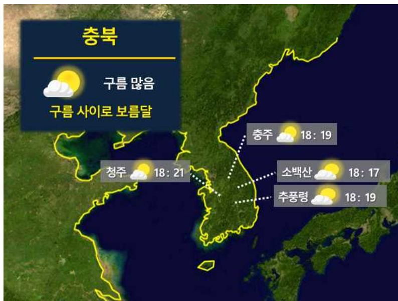
[ 9월 29일(금) 충북 월출 시각 ]