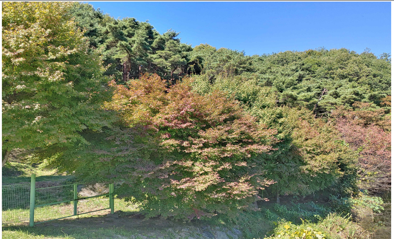
(근접) 팔공산 수태교