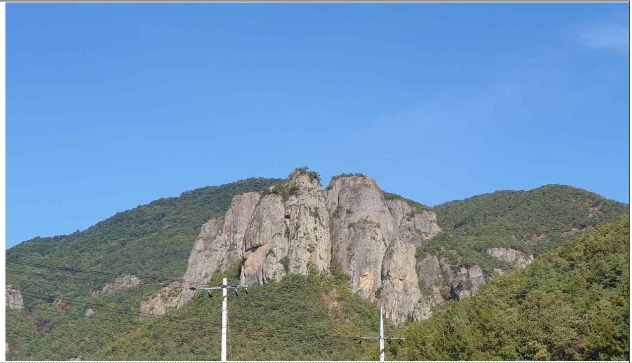
(전경) 주왕산 국립공원사무소 앞