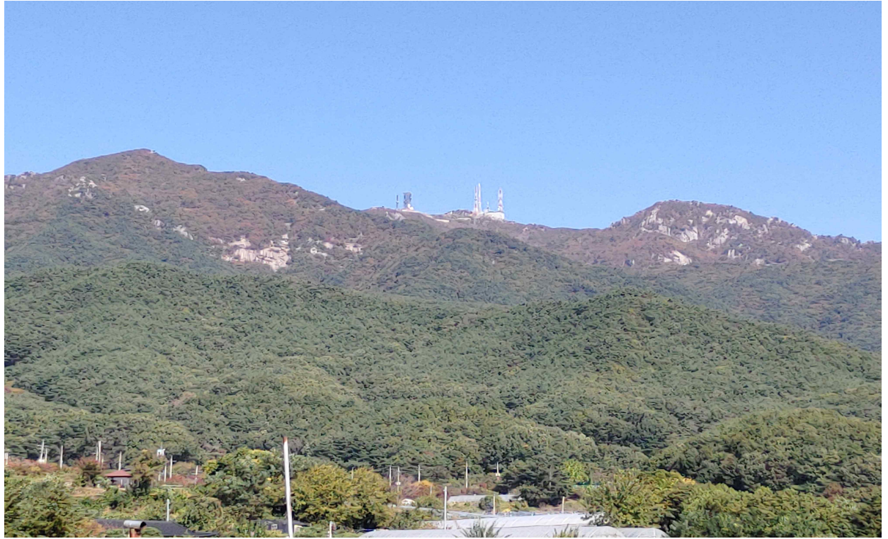
(전경) 팔공산로에서 신안사랑마을 진입로에서 바라본 전경