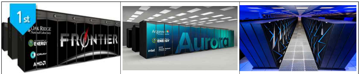
< 1위: Frontier(미국) >