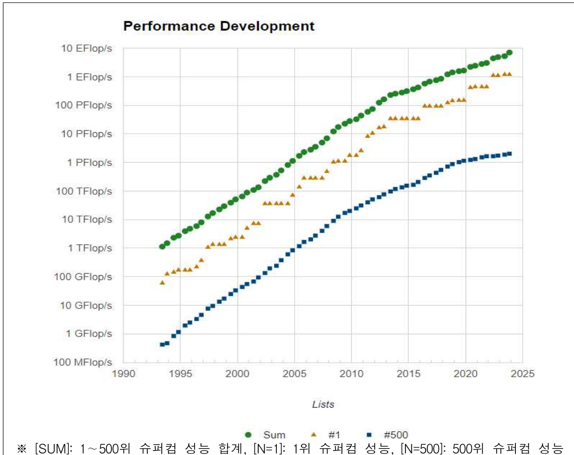
< TOP500 슈퍼컴퓨터 성능 변화 >

※ 높은 성능향상률은 AI수요 증가에 따른 대규모 GPU기반 시스템 도입 등의 영향으로 보임