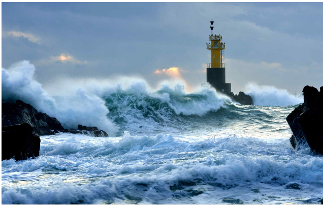
[동상] 너를 삼키고 말거야 (촬영지: 경주시 감포읍)