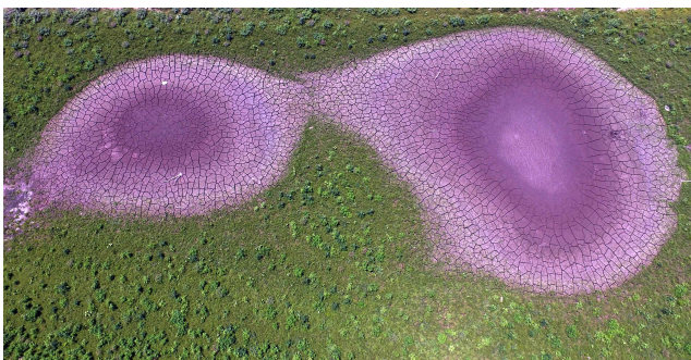
[은상] 가뭄이 만든 신비로움 (촬영지: 충남 보령시 보령호)