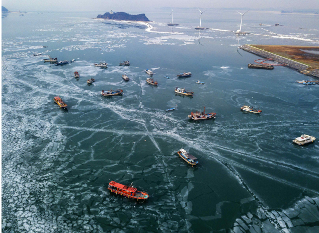
[대상] 겨울바다 (촬영지: 경기도 화성 전곡항)