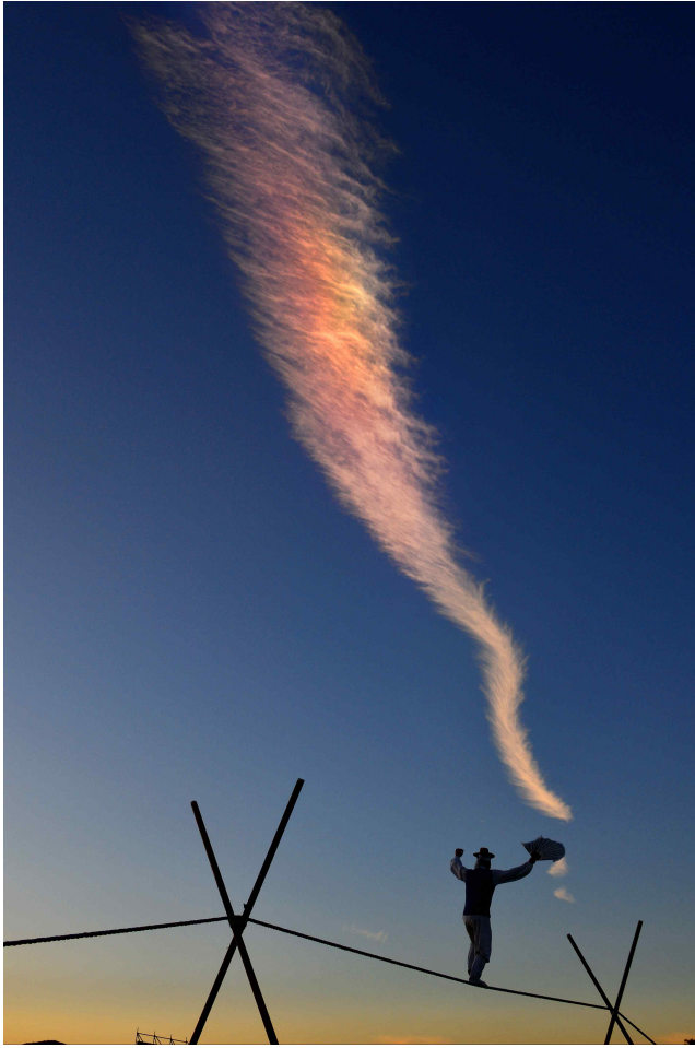
[동상] 동아줄 구름 (촬영지: 경주시 교동)