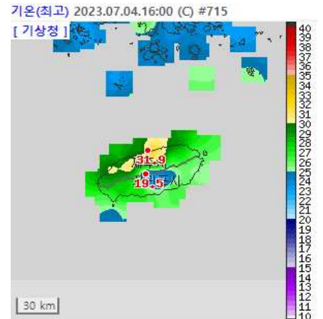
23.7.4. 16시 기준 일최고기온