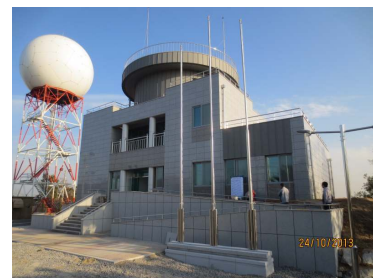
< 테스트베드 구축 > '13.10.28.