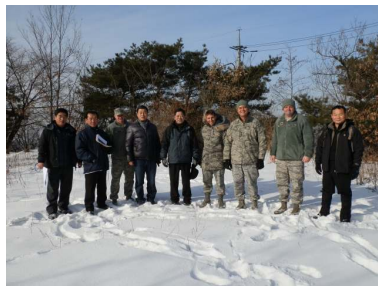
< 부지 합동점검 > '13. 1. 8.