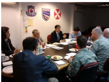
< 책임자급 실무회의 > '12.10.10.