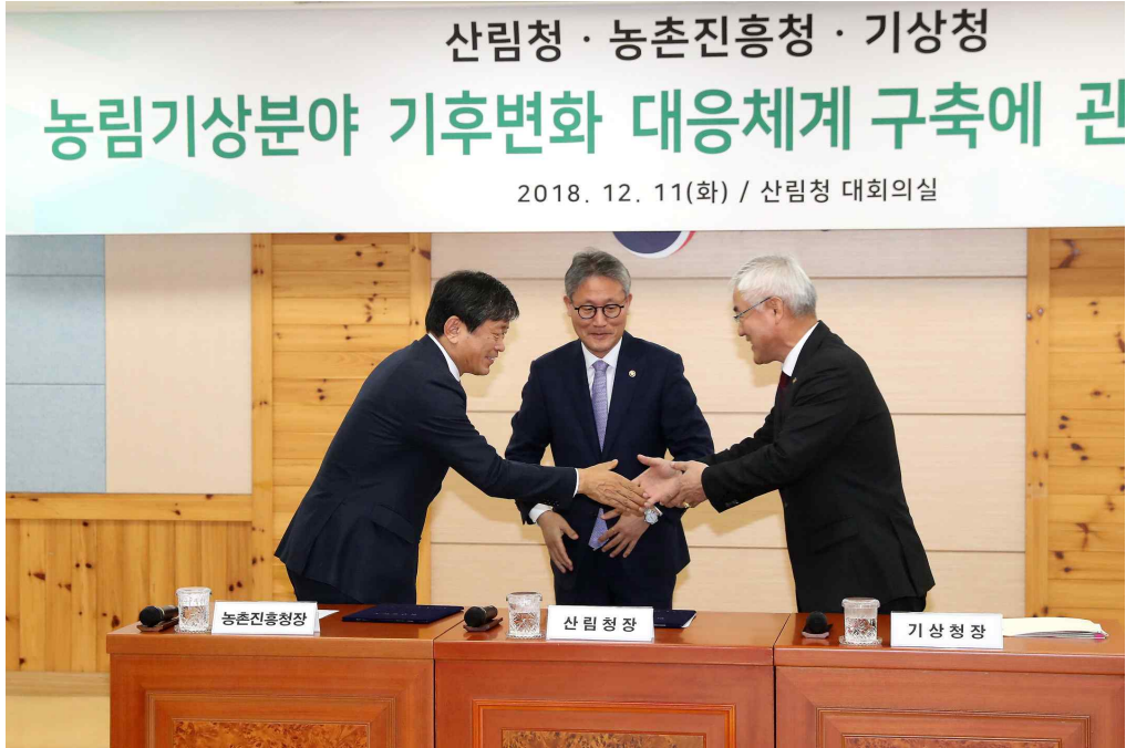
| 업무 협약식 기관장 사진 |