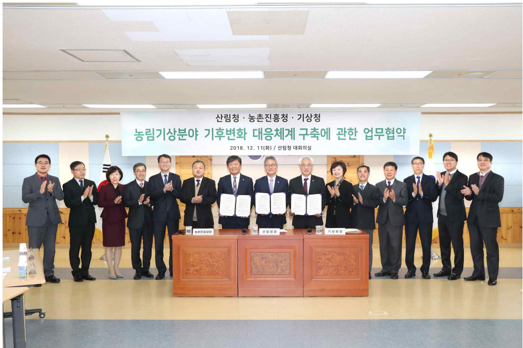
| 업무 협약식 단체사진 |