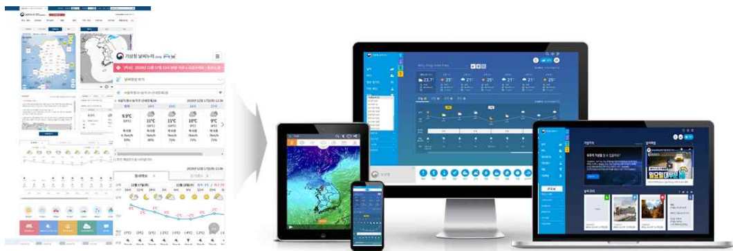
[날씨누리 개편 화면]