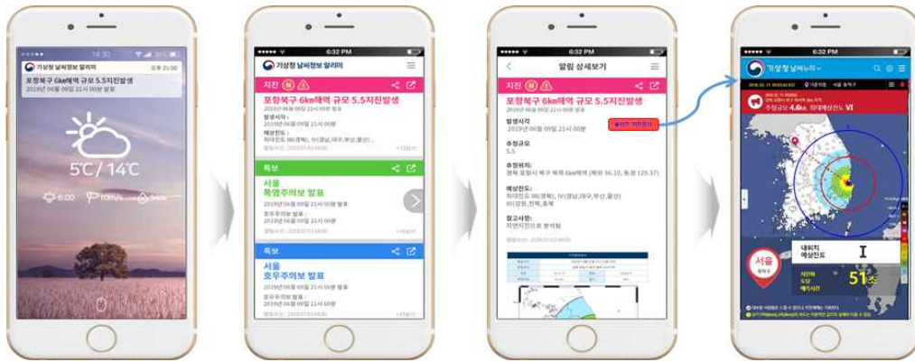
[날씨누리 실시간 지진감시 및 푸시 앱 연계]