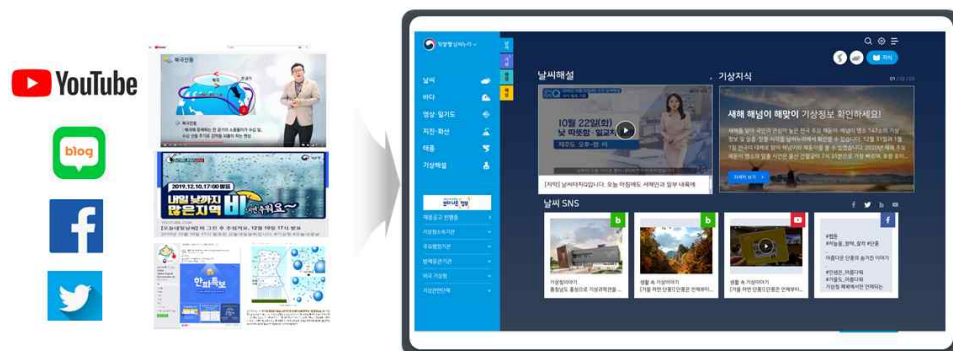
[날씨누리 지식과 소셜네트워크 서비스(SNS)]